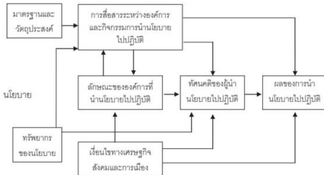
ภาพที่ 1 ตัวแบบการนำนโยบายไปปฏิบัติของแวน มิเตอร์ และแวน ฮอร์น

the Implementation Agencies) 5. เงื่อนไขทางเศรษฐกิจ สังคมและการเมือง (Economic, Social, and Political Conditions) และ 6. ทักษะของผู้ปฏิบัติงาน (The Disposition of Implementers